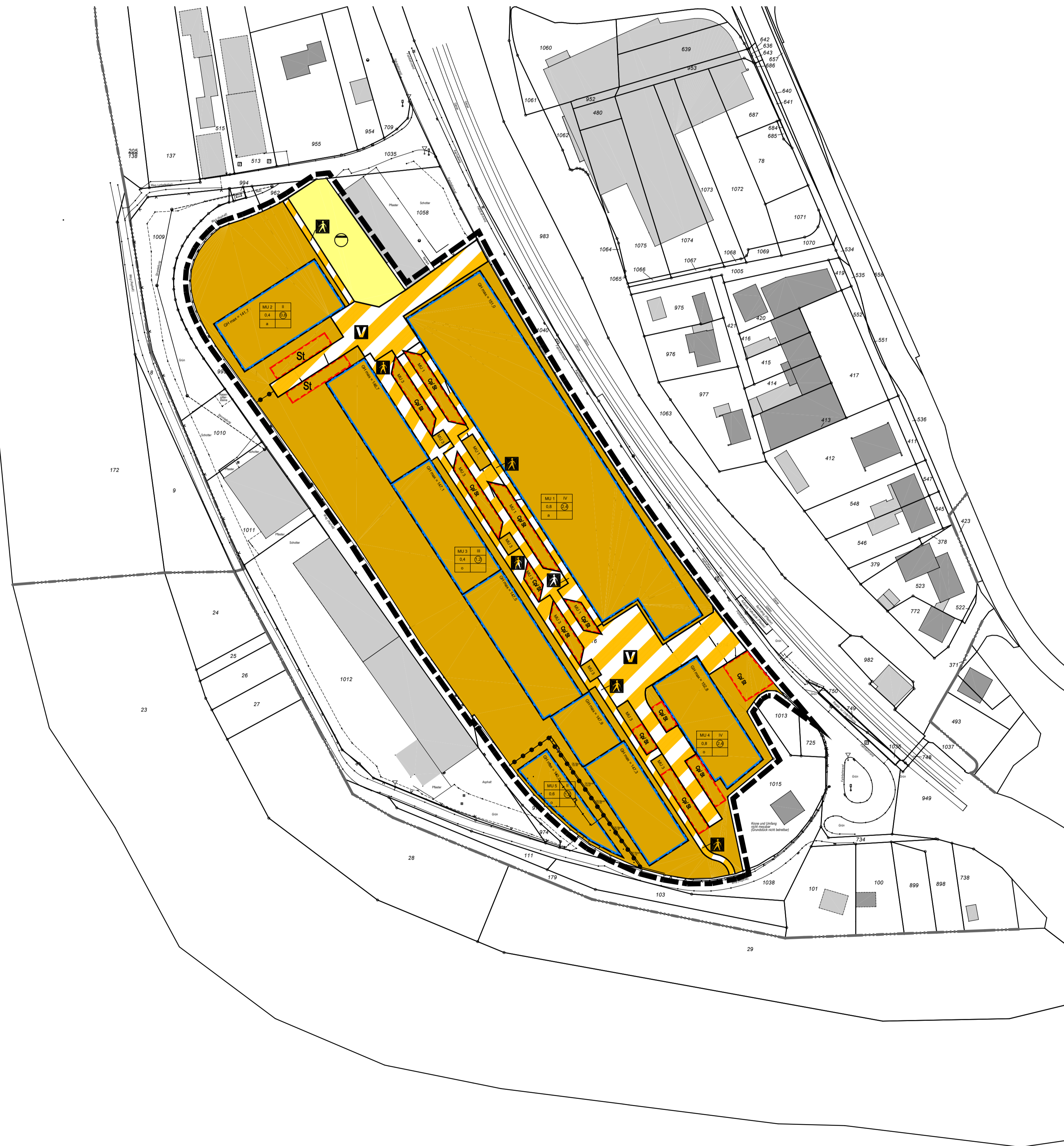
Karte 2: Landschaftspflegerische Maßnahmen